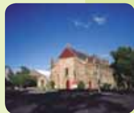
照片: Gary Deimendjian作品,雪梨市議會檔案資料

紐省第一座正式的軍用教堂,專門供駐防Dawes Point的軍人使用。身著火紅外套的軍人從砲兵營列隊前進至Lower Fort Street參加清晨的禱告,壯觀情景不難想像。雖然教堂的正式名稱為聖三一教堂(Holy Trinity Church),不過葛瑞森教堂還是較為人熟知。教堂內目前仍有軍旗裝飾;此外,位於隔壁的小博物館也展示一些軍隊裡值得紀念的事物。