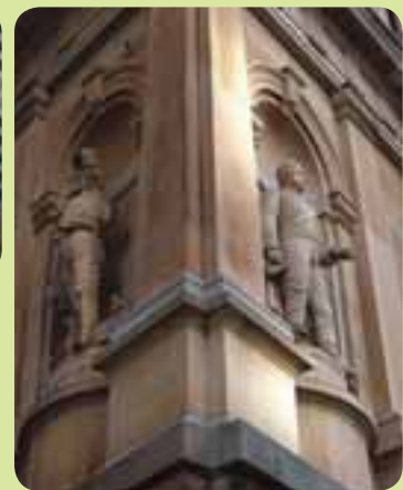
照片：Gary Demmondian作品，雪梨市議會檔案資料

橋街(Bridge Street)④予人印象深刻的地政總署(Lands Department)⑤座落於Macquarie Place的正對面。東側為多幢政府機構建築，包括教育部(Education Department)⑥、座落在第一棟政府大樓(Government House)⑦舊址的雪梨博物館(Museum of Sydney)、以及殖民大臣大樓(Colonial Secretary's building)⑧。