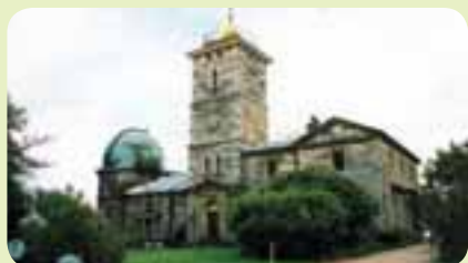
照片：Gary Deirmendjian作品，雪梨市議會檔案資料

這裡擁有全雪梨第一座風車，一般也稱此地為菲利浦堡壘或砲臺(Fort Phillip)或旗桿山丘(Flagstaff Hill)，最後則因1858年於此建立一座砂岩天文台而定名為天文台丘(Observatory Hill)。雖然對殖民天文學家這是進行科學觀察的建築物，但雪梨居民，這卻是最好的計時器。每天下午一點，尖塔頂端的球體會落下，指出正確的時間。天文台的入口設於山丘上，每天開放參觀，其花園則是欣賞山下美麗港灣與碼頭風光的好地點。